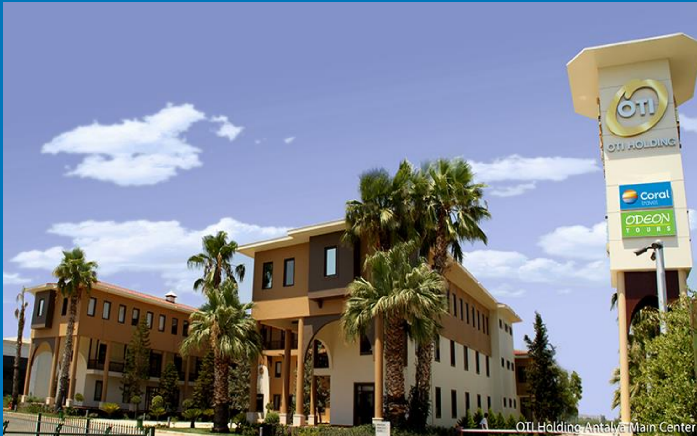
OTL Holding Antalya Main Center

МЕЖДУНАРОДНАЯ ТУРИСТИЧЕСКАЯ КОМПАНИЯ «ODEON TOURS» является принимающей стороной туроператора «CORAL TRAVEL», головной офис компании находится в Турции г. Анталия